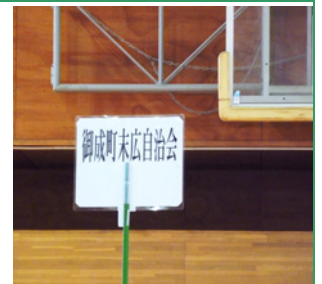
各自治会のプラカード