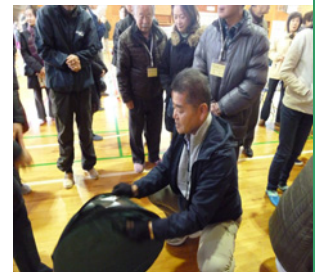
トイレ用テントの組立