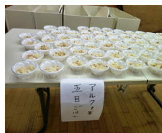
アルファ米五目ご飯