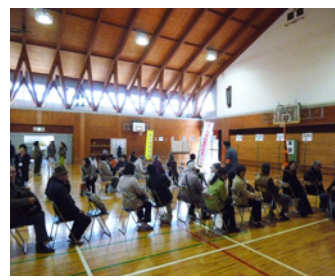
御成小学校の講堂に集合

当日は各町内毎に一時避難所に集合後、御成小学校体育館に想定避難を開始、10時に受付訓練を済ませた各自治町内会からの参加者170人余りが体育館内に集合。10時半より防災役員・市役所防災課より避難所機能他の説明、その後居住スペース用パーテーションの設営や簡易トイレの組み立てを通じて、避難所開設時の行動を