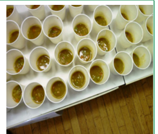
野菜スープの試食

実体験出来ました。訓練後には構内備蓄倉庫の見学と質疑応答、家庭科室での非常食の調理体験、多目的ルームでの試食で避難時の食糧対応を実感できました。