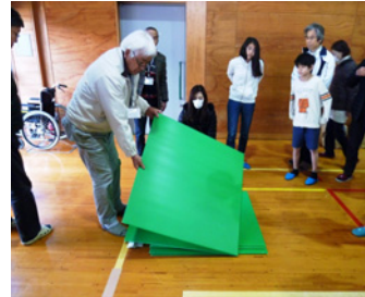
折りたたみパーテーション