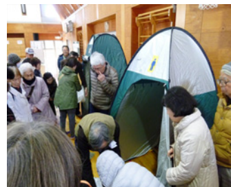
簡易トイレの設置訓練